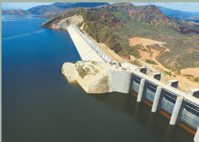
Imatge 4. Hidroelèctrica El Quimbo.

Finalment, la pèrdua de biodiversitat , és a dir, la disminució o desaparició de la diversitat biològica, que inclou animals, plantes, ecosistemes i en general tota vida existent.