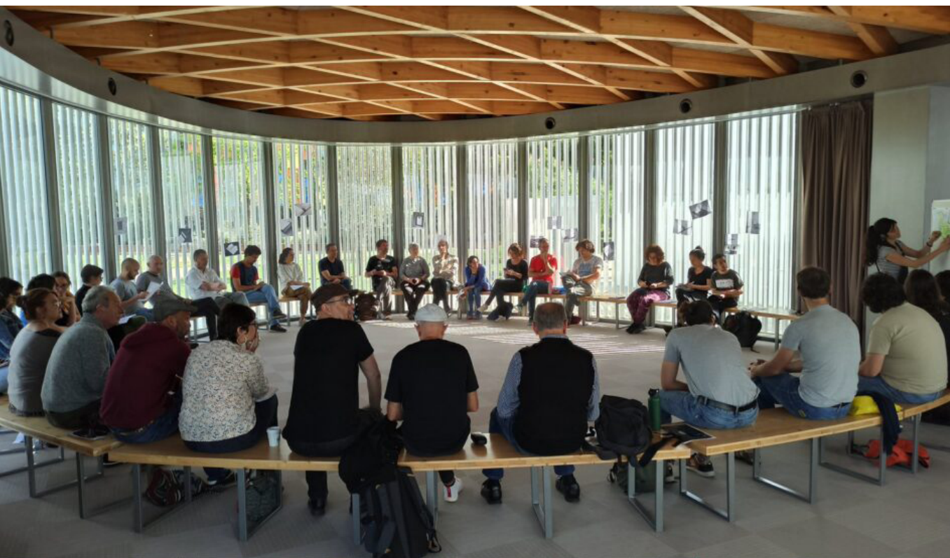
Imatge 7. Trobada estatal d'entitats de la societat civil organitzada en contra del poder corporatiu. Prat del Llobregat, Barcelona. 21 i 22 d'abril de 2023.

Es tracta d'una iniciativa de regulació d'àmbit català que ha estat impulsada i treballada pel Grup Català d'empresa i drets humans des de l'any 2015. Actualment, després de molts anys, diverses resolucions favorables i registres davant el Parlament de Catalunya, les organitzacions impulsores esperen que el compromís manifestat pels grups parlamentaris es mantingui per a la nova legislatura que ha iniciat l'any 2024. Durant molts anys s'ha treballat la fórmula que faci possible i la creació d'un organisme públic que compti amb una sèrie de característiques fonamentals -independent, eficaç, accessible, compromès i valent- que li permeti aconseguir un dels seus principals objectius: "vetllar perquè la internacionalització de l'economia catalana no generi impactes negatius ni vulneri els drets humans, especialment en països empobrits" 77 .