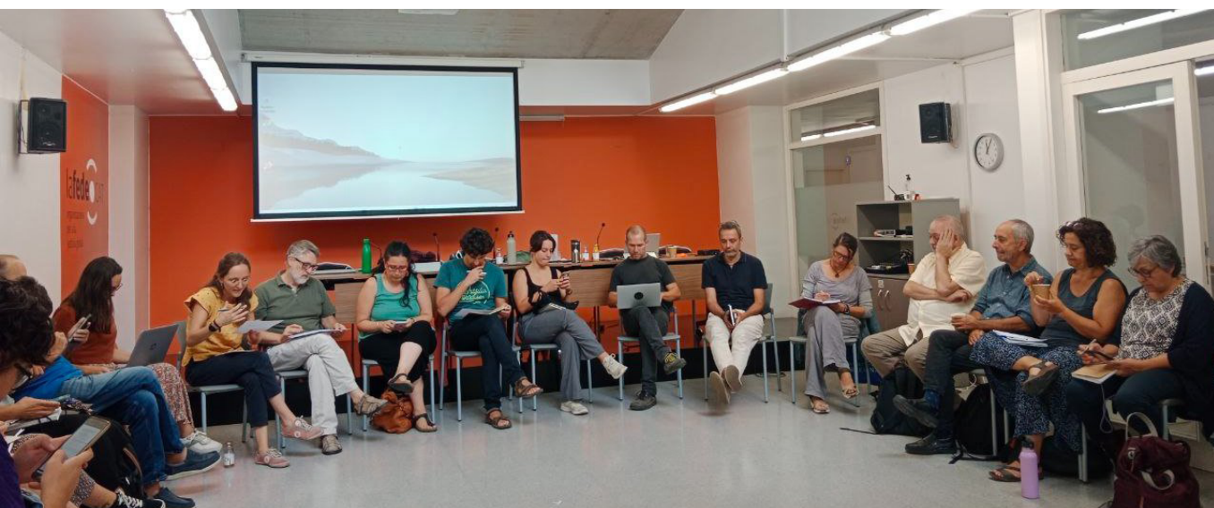
Imatge 6. Taller formatiu sobre la directiva europea de diligència deguda i la creació del Centre Català d'Empresa i Drets Humans. Seu de LaFede.cat, Barcelona. 17 de setembre de 2024.