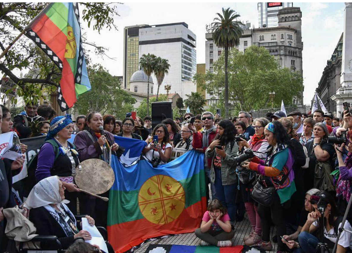
Imatge 1. Protesta en contra de la detenció de set dones activistes de la comunitat indígena Lafken Winkul Mapu sense conèixer els seus càrrecs. Villa Mascardi, Argentina. 10 d'octubre de 2022. Més informació: enllaç .

8. A mode d'exemple, vegeu el llistat al que fa referència la recentment aprovada Directiva de deguda diligència de la Unió Europea en el seu annex, part 1 i 2.