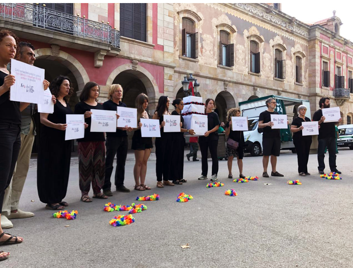
Imatge 10. Acte de protesta en motiu de la dilatació del procés legislatiu de la Llei de creació del Centre Català d'Empresa i Drets Humans al Parlament de Catalunya. Parlament de Catalunya, Barcelona. 5 de juliol de 2022. Més informació: enllaç .

A l'informe " Transnacionals vs. drets de les dones " es documenten i presenten les afectacions específiques que tenen les activitats de les ETN sobre els drets de les dones a països com Colòmbia i Guatemala, incidint en què "la violència contra les dones no ha d'analitzar-se com un dany col·lateral a l'extractivisme, sinó que constitueix un dels eixos principals dels atacs de les ETN".