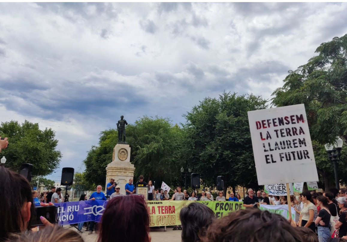
Imatge 9. Manifestació "Llaurem el futur" en contra del projecte Hard Rock Entertainment World. Tarragona. 18 de juny de 2023. Font pròpia.

Un cop esmentades algunes accions i estratègies destacades en aquest àmbit, a continuació es posa en valor algunes reflexions pràctiques entorn d'idees i conceptes que formen part de la tasca quotidiana que porten a terme les persones, entitats i col·lectius reunits al llarg dels darrers dos anys 83 . L'objectiu d'aquestes trobades ha estat generar espais de mutu coneixement per facilitar l'articulació i la incidència conjunta quan això sigui possible.