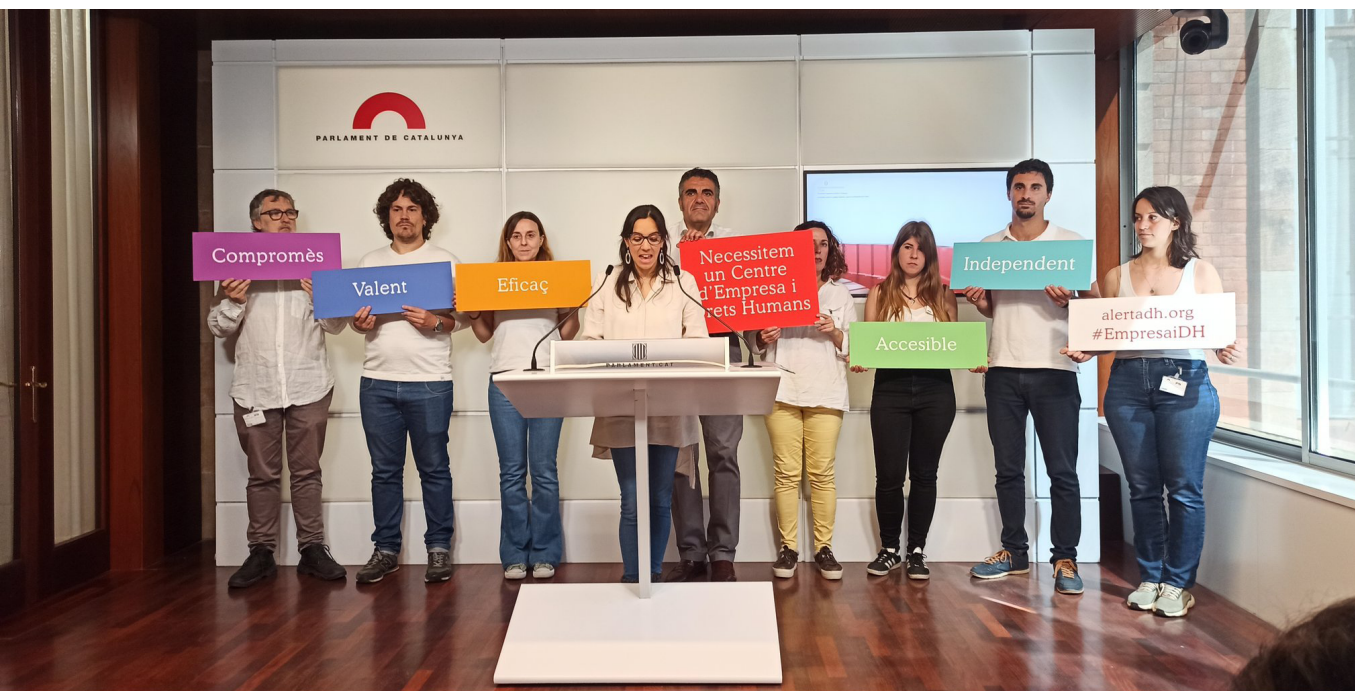
Imatge 8. Roda de premsa al Parlament de Catalunya en motiu de l'inici del període d'esmenes a la Llei de creació del Centre Català d'Empresa i Drets Humans. Parlament de Catalunya, Barcelona. 4 de maig de 2023. Més informació: enllaç .

La proposta de Llei preveu que el Centre disposi de competències per investigar i, eventualment, sancionar en cas d'incompliment d'obligacions d'accés a la informació per part de les empreses incloses en l'àmbit d'actuació del Centre.