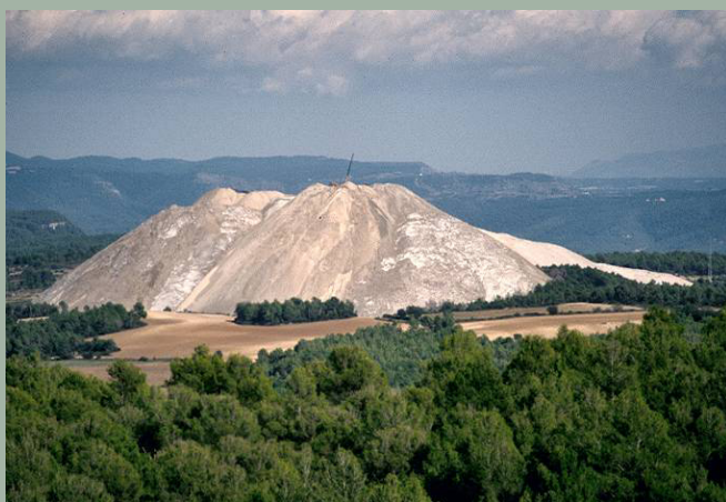
Imatge 3. Desastre Mediambiental al Bages.

Un altre element destacat és la contaminació de l'entorn , és a dir, l'alteració en presència i quantitat de les substàncies que en condicions naturals es troben en un entorn determinat. La contaminació és problemàtica quan l'alteració provoca conseqüències nocives i perjudicials per a la salut i la vida dels éssers que habiten l'entorn contaminat.